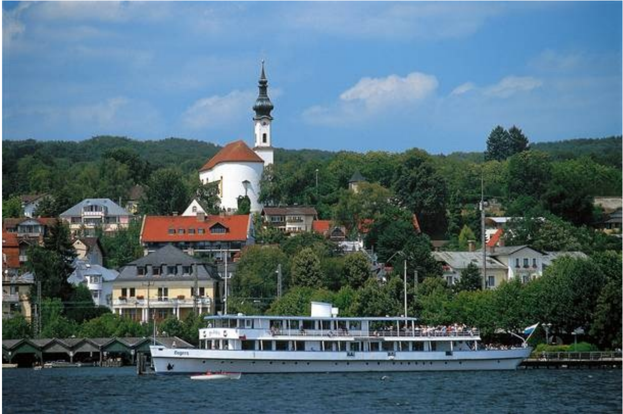
Blick auf Starnberg vom Starnberger See