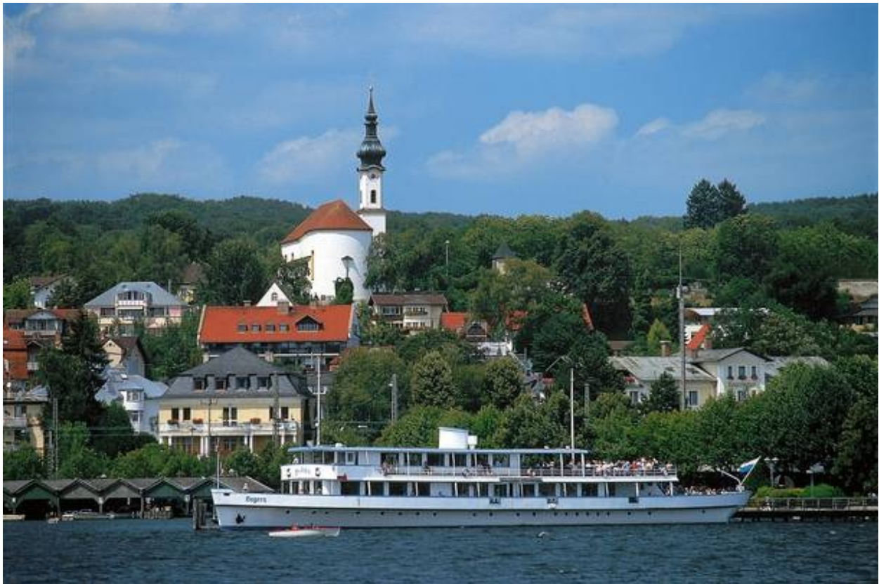
Blick auf Starnberg vom Starnberger See

Wir wünschen allen eine erholsame Urlaubszeit!