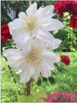
Clematis Arctic Queen

Wir sind nicht nur verantwortlich für das, was wir tun, sondern auch für das, was wir nicht tun.